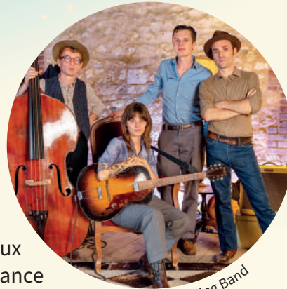
Dandelion String Band