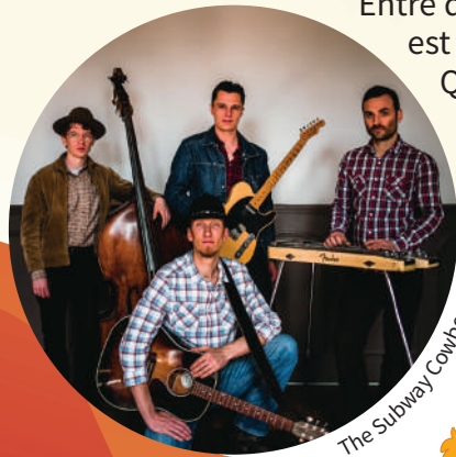
The Subway Cowboys